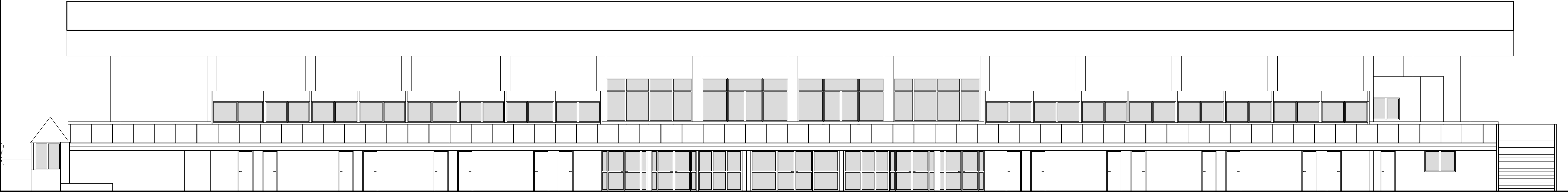
FACHADA CALLE ZORRILLA